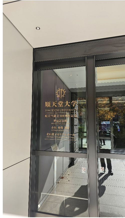
エントランス入って右側のエレベータで 13F