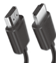
図 HDMI コネクター