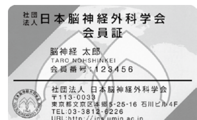
(一社)日本脳神経外科学会 会員証